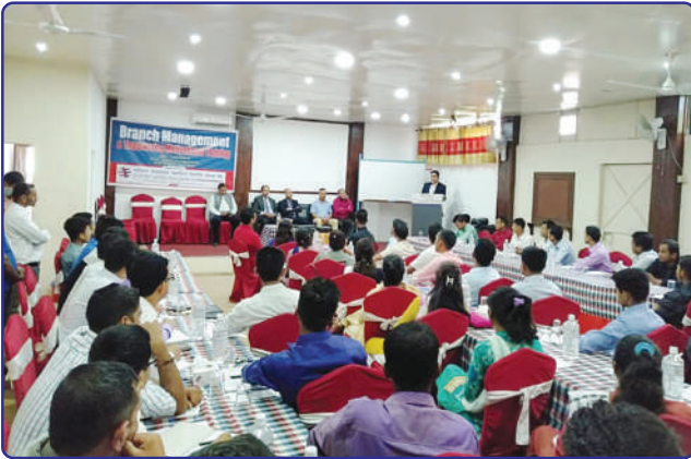
शाखा प्रमुखहरूलाई शाखा व्यवस्थापन तालिम