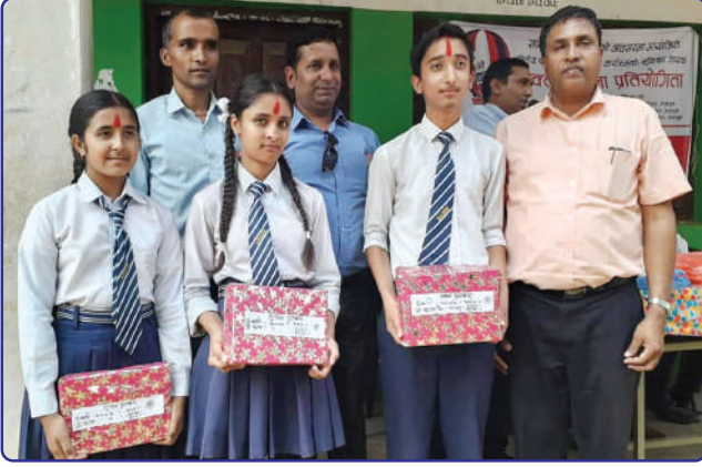
वित्तीय साक्षरता अन्तर्गत वक्तृत्वकला प्रतियोगिताका विजेताहरूलाई पुरस्कृत गर्दै