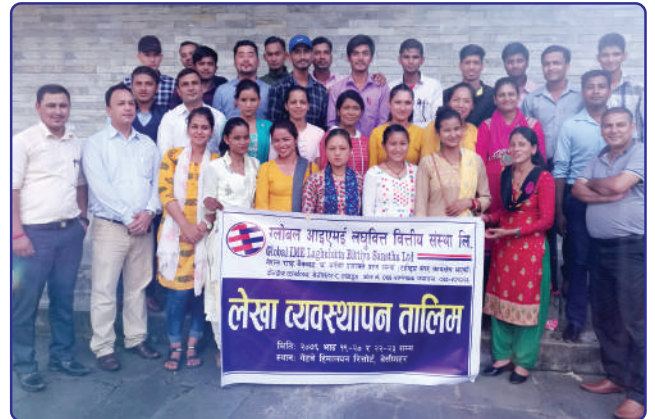
लेखा व्यवस्थापन तालिम