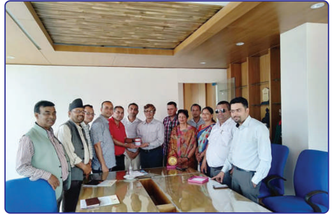
कार्यकारी प्रमुखबाट बंगलादेशको भ्रमण