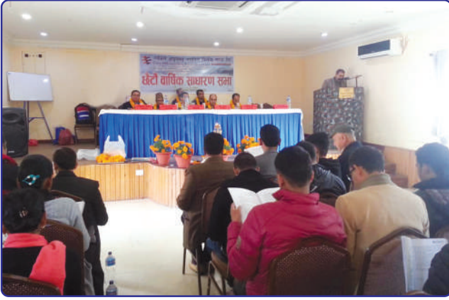
छैटौं वार्षिक साधारण सभा कार्यक्रम