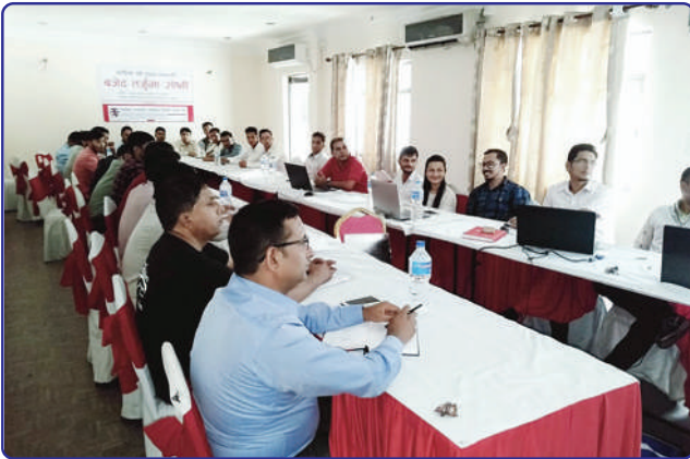
बजेट तर्जुमा गोष्ठी