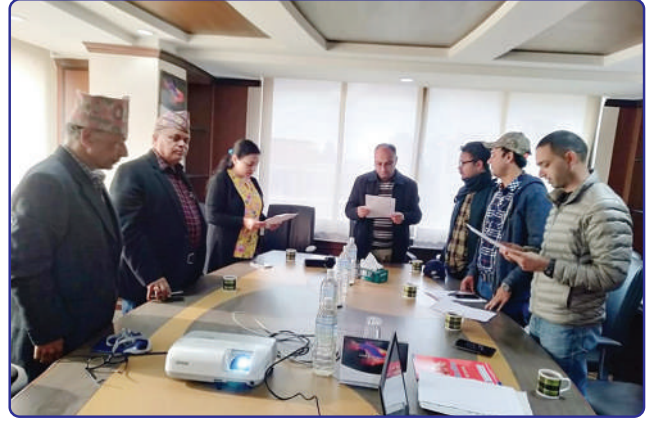
नवनिर्वात सञ्चालकहरूको सपथ ग्रहण कार्यक्रम