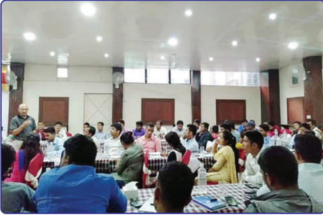
शाखा व्यवस्थापन तालिम