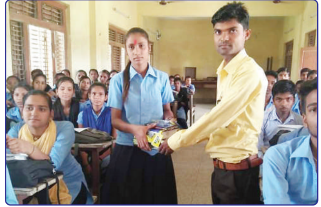
गरिब तथा जेहेन्दार छात्रालाई शैक्षिक सामग्री वितरण गर्दै