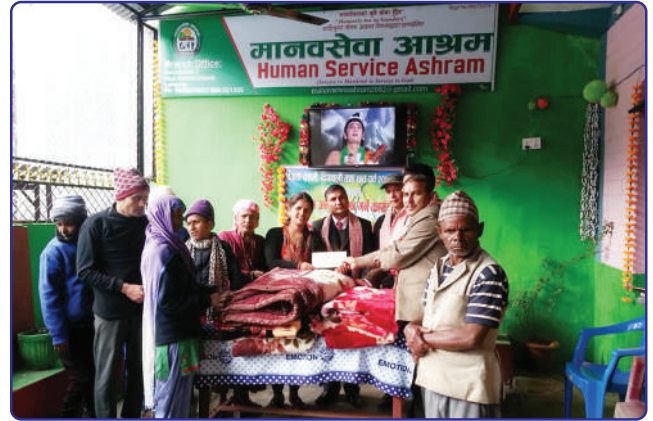
मानवसेवा आश्रम, लमजुङलाई न्यानो कपडाहरू हस्तान्तरण