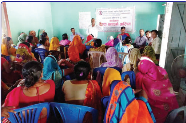
सरफ बनाउने तालिममा सहभागी सदस्यहरू