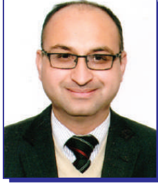
बुद्धि अकेला अध्यक्ष