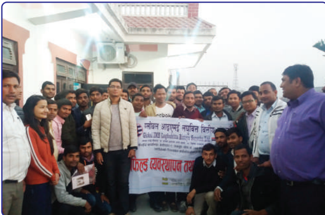
फिल्ड व्यवस्थापन तालिम