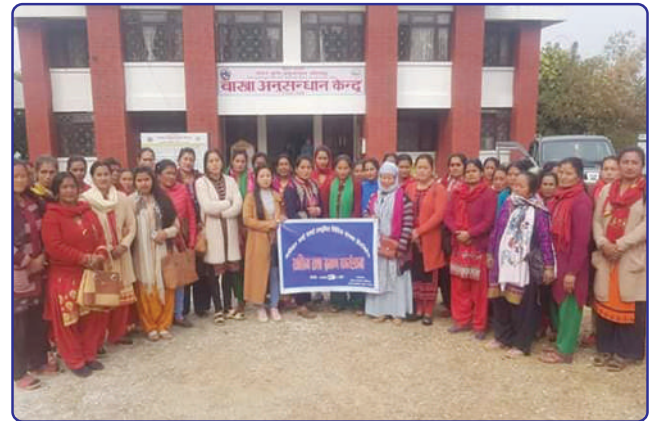
बास्त्रा अनुसन्धान केन्द्रको भ्रमणमा बास्त्रापालक सदस्यहरू