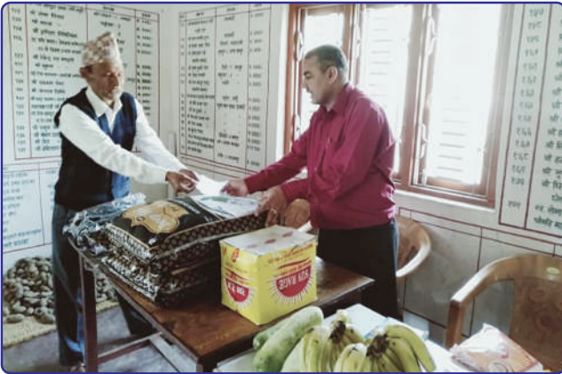
सर्वोदय सेवाश्रम, लमजुङलाई खाद्यान्न सामग्री हस्तान्तरण