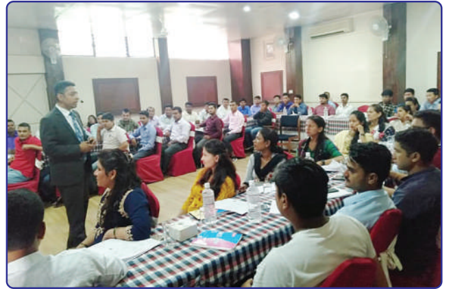
शाखा प्रमुखहरूलाई उत्प्रेरणमूलक तालिम